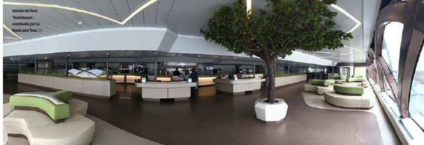
Interior del ferry "Texelstroom", construido por La Naval para Teso, EE.